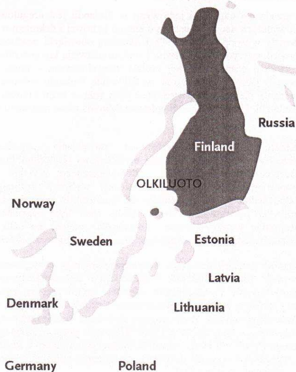
Rys. 1-2. Położenie miejscowości Olkiluoto na mapie Finlandii